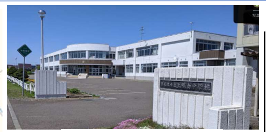
岩見沢上幌向中学校