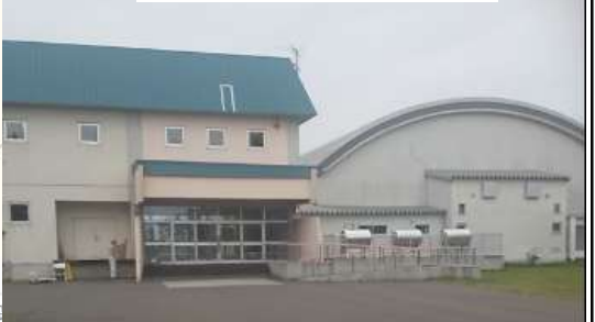
岩見沢第二小学校

物件概要 ■分譲区画/46区画 ■土地面積/平均77.68坪 ■価格/全区画150万円 ■所在地/岩見沢市上幌向南2条8丁目5-5他 ■交通/中央バス「上幌向工業団地」徒歩7分、上幌向駅より車で3分、徒歩20分 ■地目/宅地 ■用途地域/第一種中高層住居専用地域 ■建ぺい率/60% ■容積率/200% ■設備/上下水道、電気、LPG、道路幅員9m（一部8m） ■岩見沢市立第二小学校徒歩3分、上幌向中学校2km